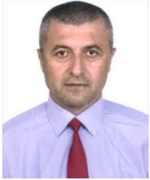
Yiyecek ve İçecek İşletmeciliği Bölüm Başkanı

Halen, Muğla Sıtkı Koçman Üniversitesi, Turizm Fakültesi’nde öğretim üyesi ve Yiyecek İçecek İşletmeciliği bölüm başkanı olarak görev yapmaktadır.