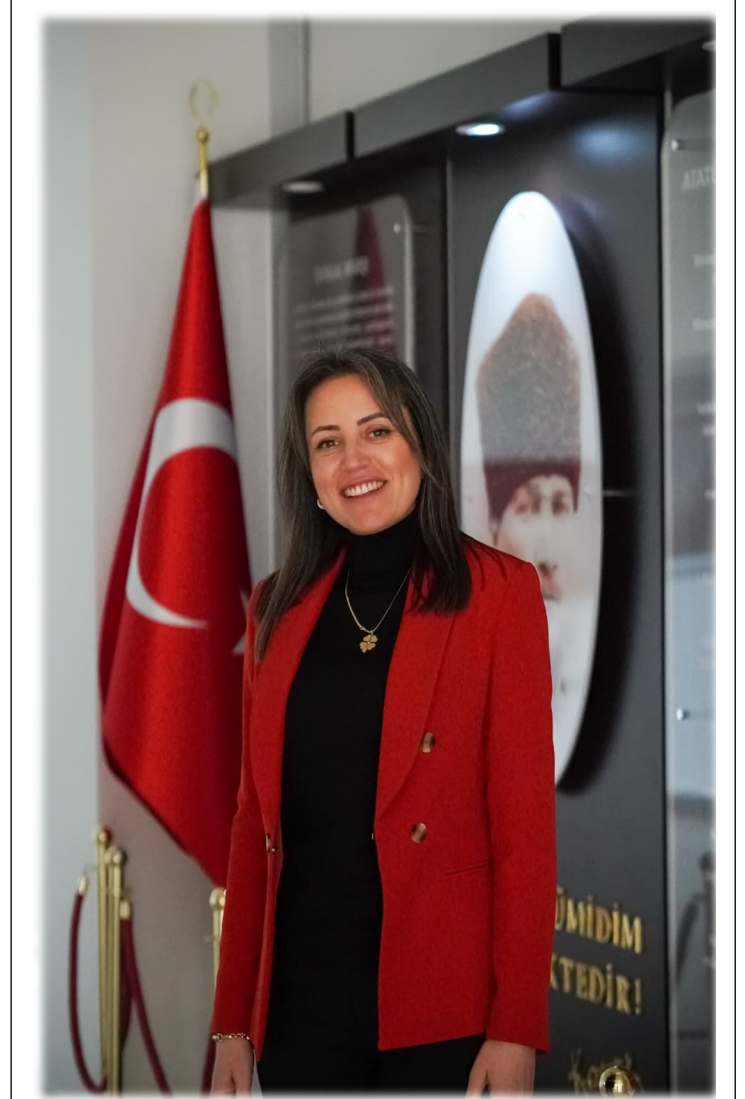
Turizm Rehberliği Bölüm Başkanı

Mart 2022 itibarıyla Turizm Bilim Alanı'nda Doçent unvanını alan Ön, 2023 yılında Muğla Sıtkı Koçman Üniversitesi Turizm Fakültesi Turizm Rehberliği Bölümü'ne atanmış olup, aynı tarihten bu yana bölüm başkanlığı görevini sürdürmektedir.